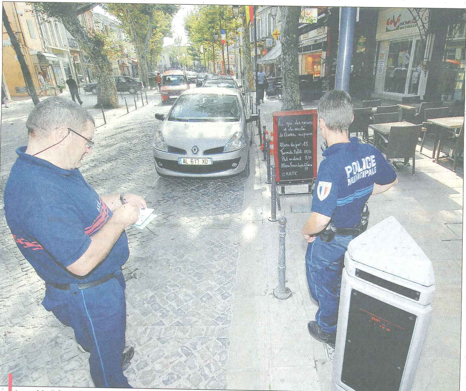
La municipalité de Châteaurenard pose des capteurs au sol pour que les dépassements de stationnement soient sanctionnés. P.12

CHEZ CITROËN FÉLIX FAURE LE SALON DES BONNES AFFAIRES C'EST EN OCTOBRE