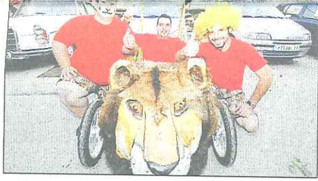
Trois amis participent demain avec leur caisse à savon au concours qui a lieu à Lyon. P.13